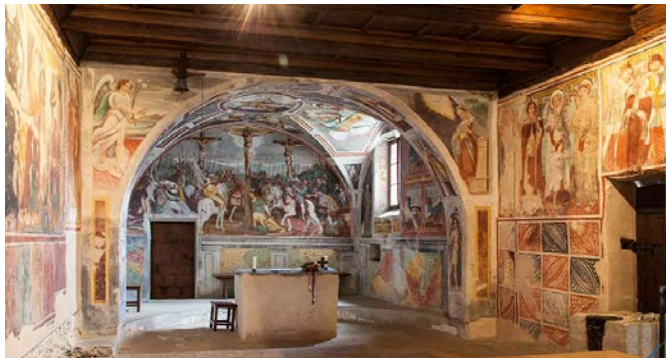
Kirche in Curzutt im Tessin