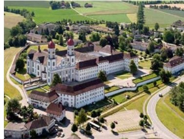
Zisterzienserkloster St. Urban