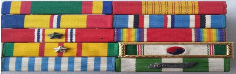
Jakob Müller AG Bandweberei, Frick